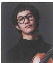
福田 廉之介 ヴァイオリン

プレシア音楽アカデミー教授も兼任。ルツェルン音楽祭、ヴェルビエ音楽祭、ザルツブルグ音楽祭、ラ・フォルジュルネ、BBCプロムス、チャイコフスキー音楽祭、サンフランシスコ音楽祭など多数の音楽祭に招かれる。これまでに、庄司紗夕香、榎本大進、ギドン・クレーメル、ミクロシユ・ペレーニ、ダニエル・ホープ、メナハム・プレスラー各氏、エベヌ・カルテット、クス・カルテット等と共演。ソリストとしては、バイエルン放送響、クレメラータ・バルティカ、ベネズエラ交響楽団、ミュンヘン室内管弦楽団、ジュネーブ室内管弦楽団等と共演を果たす。第53回ミュンヘンARD国際音楽コンクール・ヴィオラ部門第3位。